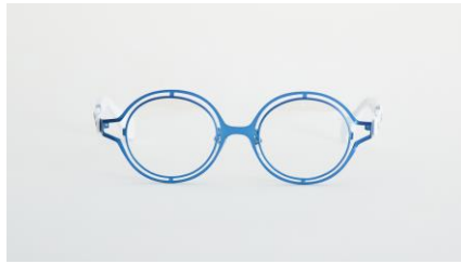
ブルー「タチコマカラー」