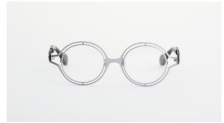
ベージュ「草薙素子フォーマル服カラー」