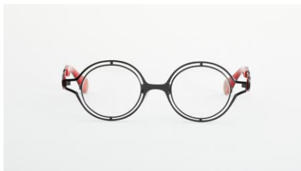
ブラック「草薙素子忍者服カラー」

ブラック「草薙素子忍者服カラー」、ブルー「タチコマカラー」、ベージュ「草薙素子フォーマル服カラー」の3種類